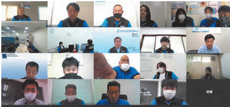
大勢が参加し、初めてオンラインで開催した成果発表会

アイ・リンクグループ各社で、スタッフさんがチームを作り、目標達成に取り組む「小集団活動」その成果を発表する「2022年度下期成果発表会」が2023年5月25日に開かれました。今回は石島運輸倉庫、石島運輸倉庫西日本、マルトウ、アイ・ロジアドバンス、平和自動車工業、アイ・リンクホールディングスの6社、計15チームが22年度10月～3月の取り組み成果を発表。最優秀賞に石島運輸倉庫の「攻める伊勢崎」（伊勢崎物流センターチーム）が選ばれました。おめでとうございます。