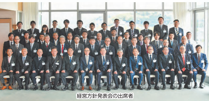
経営方針発表会の出席者

今回は、石島運輸倉庫、石島運輸倉庫 西日本、全京運輸、アイ・リンクサービ ス、アイ・ロジアドバンス、マルトウ、平 和自動車工業、ギャバンス、協栄運輸、大 西運輸サービス、内畑運送、ニッタル運 輸、崎戸運送、福岡輸送、アイ・リンク ホールディングスの15社から役員らが 参加した。